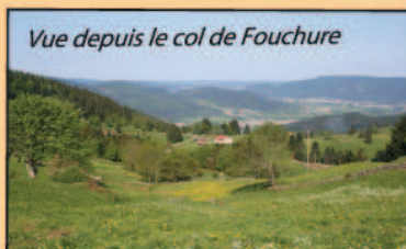
Vue depuis le col de Fouchure